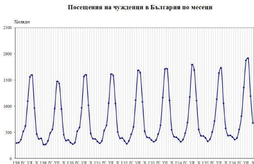
Рис. 1. Сезонное распределение потока иностранных туристов в Болгарии (2008-2016 гг.)

Число туристских посещений Болгарии быстро возрастает. По данным Национального института статистики Болгарии (НСИ) за весь 2011 г. страну посетили 8 712 851 иностранцев, для 6 328 023 из них, по определению Всемирной туристской организации, целью посещения являлся туризм. Туристы из России занимают 4 место после туристов из Румынии, Греции и Германии с 455093 посещениями [5]. В 2016 г. только за октябрь месяц Болгарию посетили 242,5 тыс. туристов, что на 18,7% больше, чем в октябре прошлого года. В целом, за последние годы прослеживается устойчивый тренд к увеличению посещений Болгарии иностранными туристами, достигающий почти 2 млн. в летний сезон с выраженными сезонными колебаниями (Рис. 1).