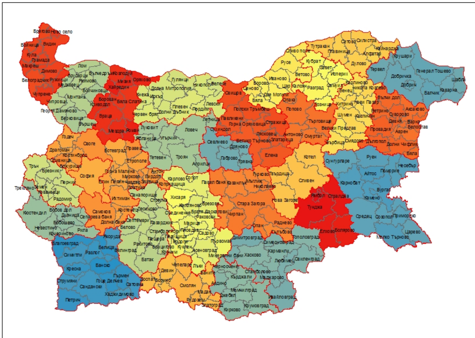
Фигура 1. Административно-териториално устройство на България, 2018 г.